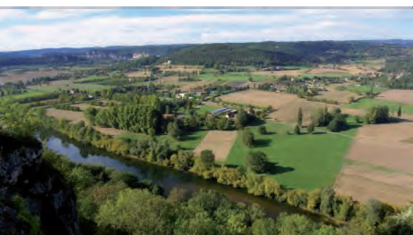
Dans le Périgord, on courtise la relève médicale

l'Intersyndicale nationale autonome représentative de médecine générale (ISNAR-IMG). Avec 7 502 postes d'internes ouverts à la rentrée, les spécialités médicales qui bénéficient de ces encouragements restent cependant les moins prisées par les étudiants. La médecine interne, la cardiologie et la radiologie arrivent toujours en tête, suivie de l'ophtalmologie où les besoins de praticiens deviennent considérables. La volonté politique affichée aujourd'hui modifiera-t-elle la trajectoire des étudiants en médecine ? En investissant dans des études longues et périlleuses, les futurs médecins n'hésitent pas à redoubler pour accéder à la spécialité qu'ils désirent pratiquer. L'an dernier, 662 postes offerts n'avaient finalement pas été pourvus, parmi lesquels 610 en médecine générale, 40 en médecine du travail et enfin 12 postes en santé publique restaient vacants. ■