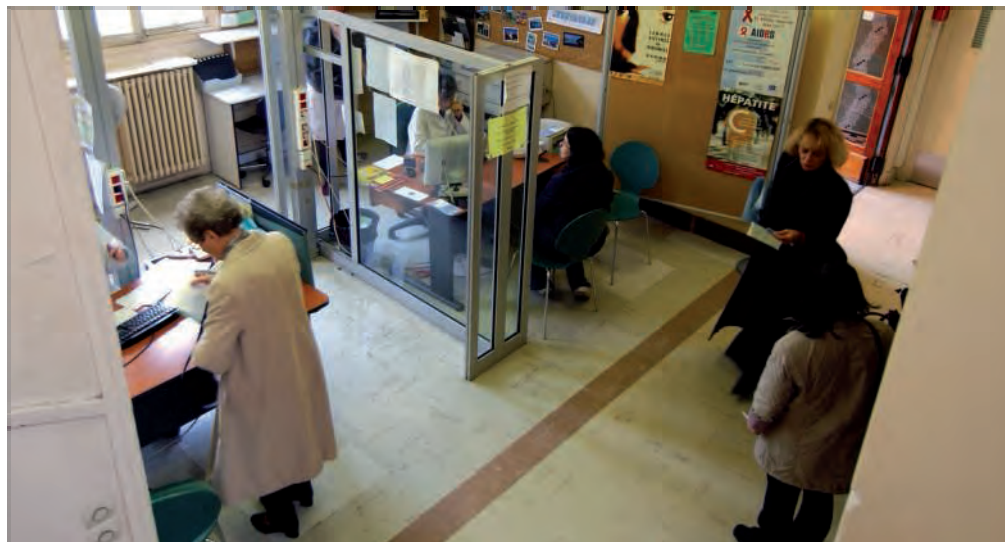
S. TOUBON/« LE QUOTIDIEN »

Les centres municipaux de santé : le vent en poupe