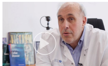
avec le Pr Christophe Cellier

Rechercher d'autres causes des symptômes